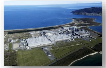
▲アルミニウム精錬所

南島の最南端に位置するサウスランド地方の中心都市。世界で最も南にある市。スコットランド人が最初に入植、開拓した都市としても有名です。現在はアルミニウム精錬を中心とした産業都市で交通の要衝でもあります。