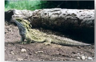
▲トウアタラ (和名: ムカシトカゲ)