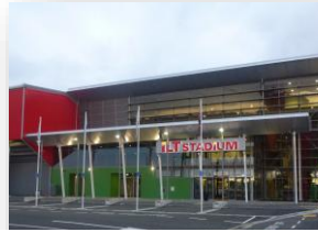
▲サウスランドスタジアム